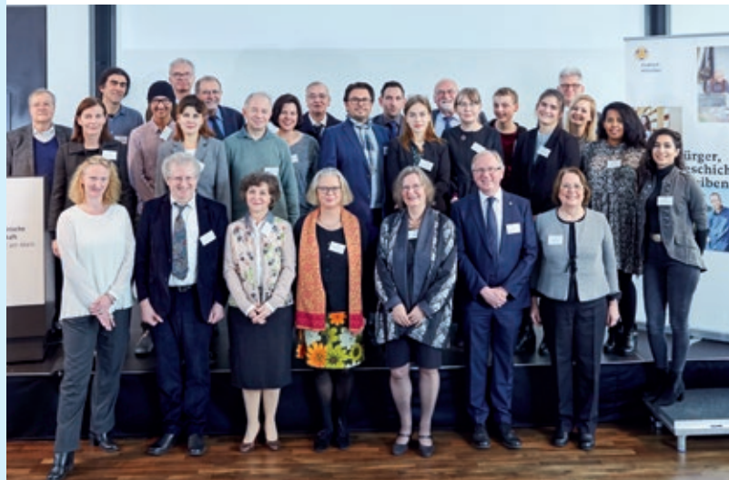
Die Aufnahme neuer Stipendiaten erfolgt am Tag der Geschichte.